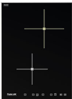
Table de cuisson Ognidove